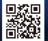
※QRコードは(株)デンソーウェーブの登録商標です。

業務効率化の推進は、多くの企業にとって重要な取り組みの一つです。人材確保が非常に困難なうえに働き方改革が求められる現状では、様々なITサービスやツールを活用してその業務を任せること、自動化すること、デジタル化で業務効率を改善させることが求められています。また、生成AIの登場によりこれまで人間にしかできなかったことが機械で簡単に行えるようになってきました。業務のデジタル化フォーラムでは、税理士、税理士事務所職員のほか、個人事業者及び一般企業の皆さまも対象として、業務効率化につながる最新のサービスやツールに実際に触れていただける展示会を実施、最新の情報をセミナーでご紹介します。ぜひお気軽にご来場ください。